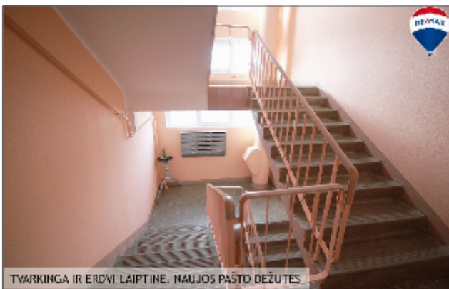
TVARKINGA IR ERDVI LAIPTINE. NAUJOS PAŠTO DEŽUTĖS