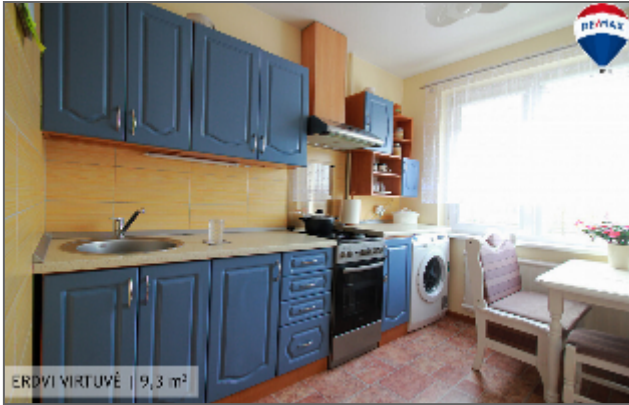
ERDVI VIRTUVĖ | 9,3 m 2