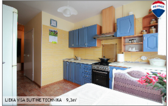
LIEKA VISA BUITINE TECHNIKA | 9,3m 2