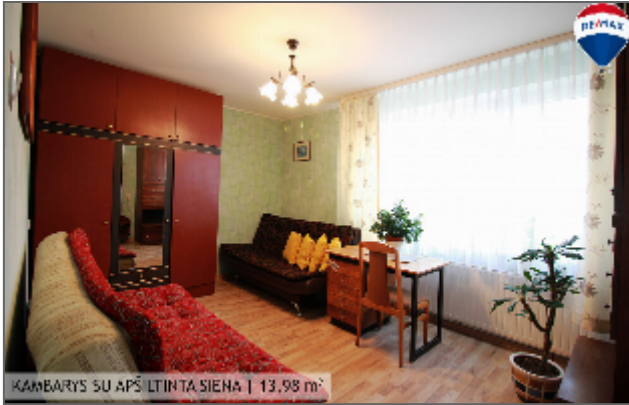
KAMBARYS SU APSILTINTA SIENA | 13,98 m 2