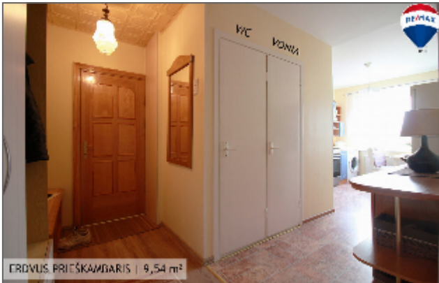
ERDVUS PRIEŠKAMBARIS | 9,54 m 2