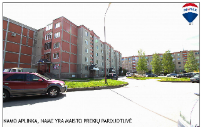
NAMO APLINKA, NAME YRA MAISTO PREKIŲ PARDUOTUVĖ