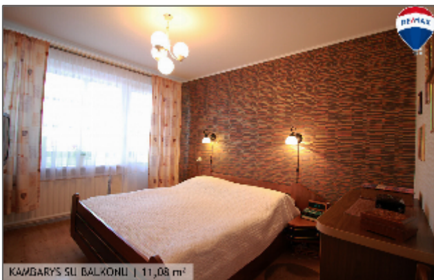
KAMBARYS SU BALKONU | 11,08 m 2