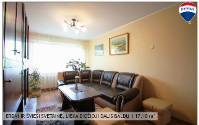
ERDVI IR ŠVIESI SVETAINĖ, LIEKA DIDŽIŲJI DALIS BALDŲ | 17,10 m 2