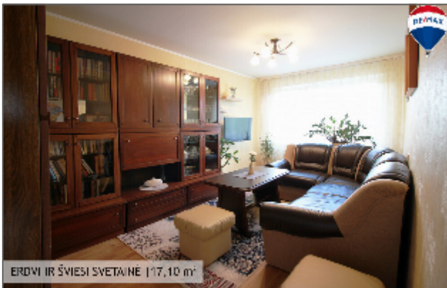
ERDVI IR ŠVIESI SVETAINĖ | 17,10 m 2