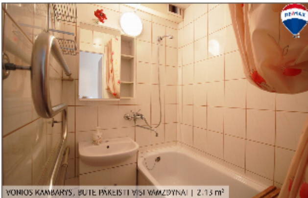
VONIOS KAMBARYS, BUTE PAKREISTI VISI VAMZDYNAI | 2,13 m 2