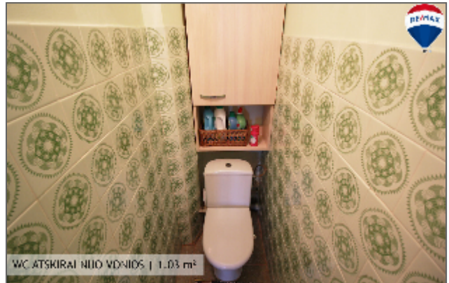
WC ATSKIRAI NIU VONIAIS | 1,03 m 2