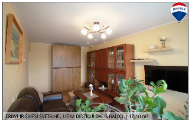
ERDVI IR ŠVIESI SVETAINĖ, LIEKA DIDŽIŲJI DALIS BALDŲ | 17,10 m 2