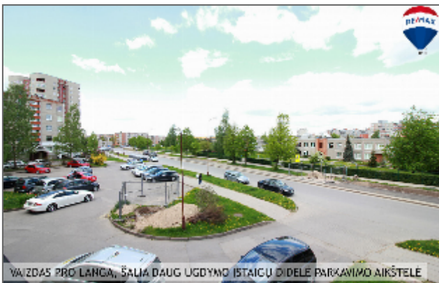
VAZDAS PRO LANČA, ŠALIA DAUG UGDYNO ISTAIGŲ DIDELĖ PARKAVIMO AIKŠTELĖ