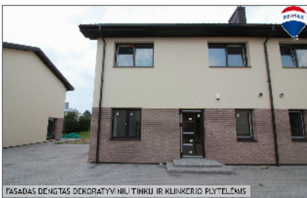
FĀSĀDAS DENGĀS DEKORĀTĪVĪ NIU TĪNKU IR KLĪNKERĪO PĻYTELĒMĪS