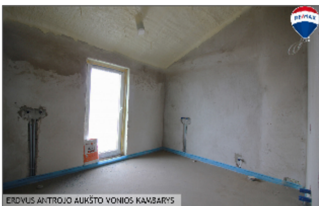
ERDVUS ANTRJOJO AUKŠTO VONIOS KAMBARYS