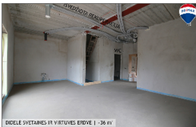
DĪDĒĻĒ SVĒTAINĒS IR VĪRTUVĒS ERDVĒ | -36 m 2