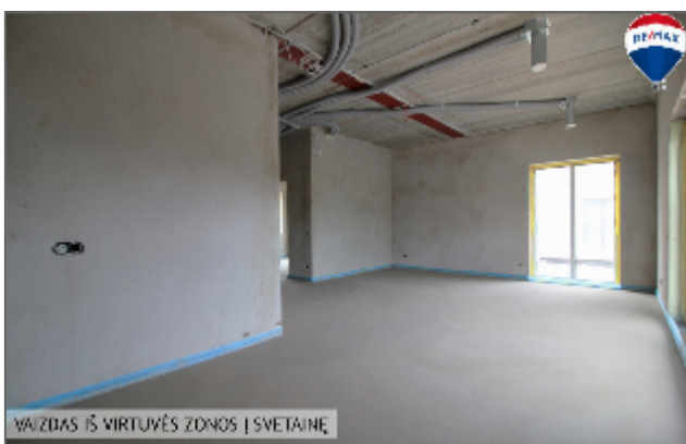
VĪZDĀS ĪS VĪRTUVĒS ZONOS | SVĒTAINĒ