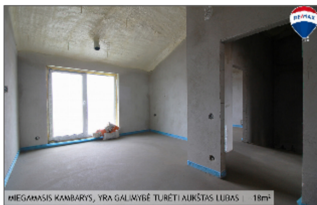
MIEGAMASIS KAMBARYS, YRA GALIMYBĖ TURETI AUKŠTAS LUBAS | -18m 2