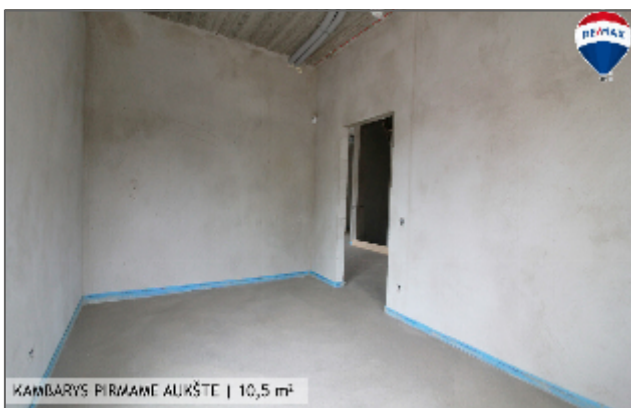
KĀMBĀRYS PĪRMĀNĒ ALĪKŠĒCĒ | 10,5 m 2