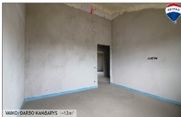
VAIKO DARBO KAMBARYS | -13m 2