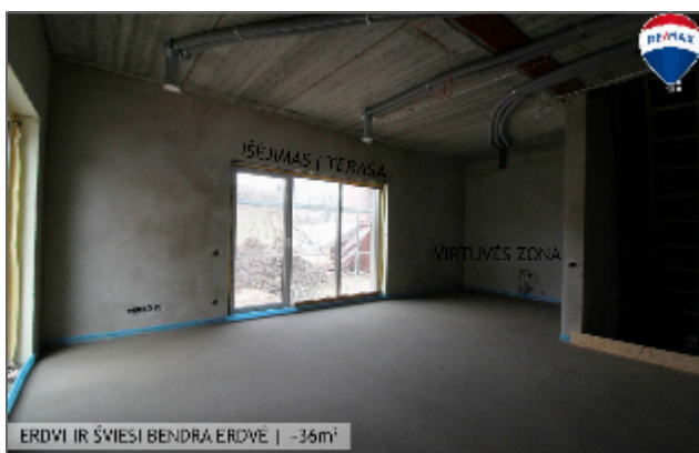
ERDVĒS IR ŠVĪESĪ BENDRĀ ERDVĒ | -36m 2