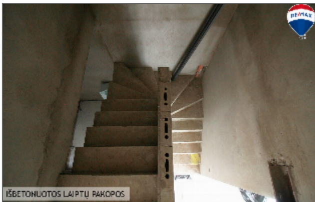
IŠBETONUOTOS LAIPTŲ PAKOPOS