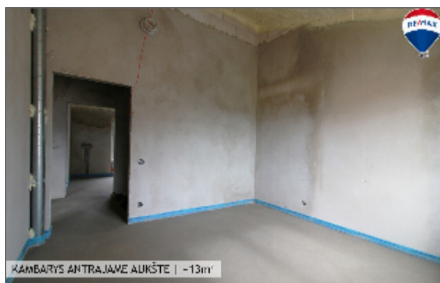
KAMBARYS ANTRAJAME AUKŠTE | -13m 2