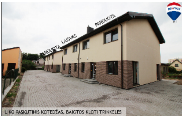
LĪKO PASKŪTINIS KOTEDŽAS, BAIGTOS KĻOTI TRINKEĻĒS