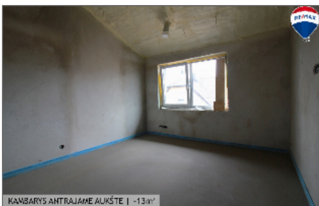
KAMBARYS ANTRAJAME AUKŠTE | -13m 2