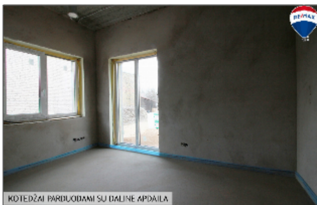
KOTEDŽĀS PĀRDUODĀMĪS SŪ DĀĻĪNĒ APDĀĪĻĀ