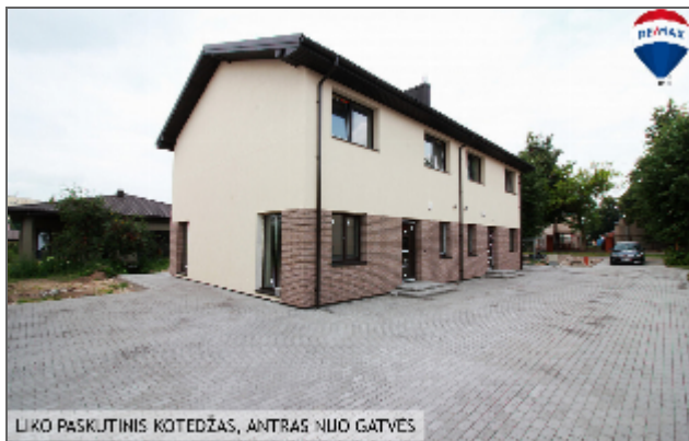
LĪKO PASKŪTINIS KOTEDŽAS, ANTRAS NIJU GATVES