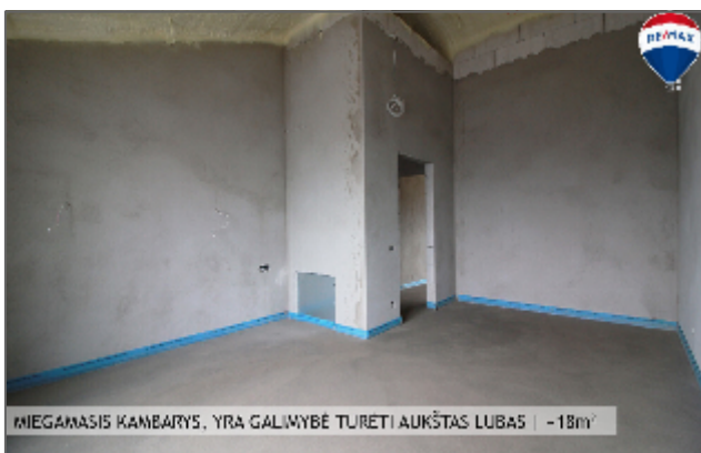
MIEGAMASIS KAMBARYS, YRA GALIMYBĖ TURETI AUKŠTAS LUBAS | -18m 2