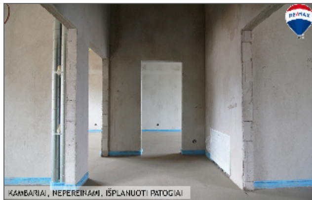
KAMBARAI, NEPEREINAMI. IŠPLANUOTI PATOGIAI