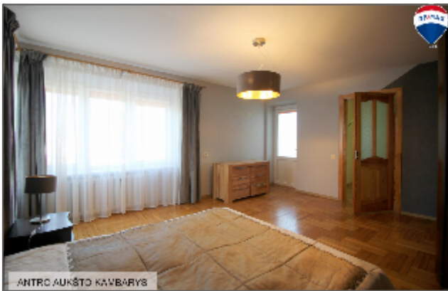
ANTRC AUKŠTO KAMBARYS