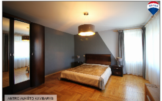
ANTRC AUKŠTO KAMBARYS