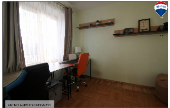
ANTRC AUKŠTO KAMBARYS