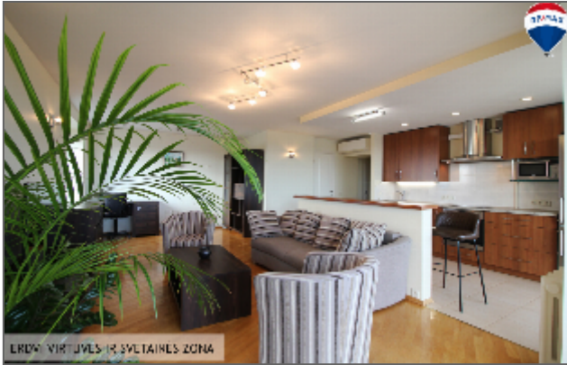
ERDAVUMAS VIRTUVĖS IR SVAJAINĖS ZONA