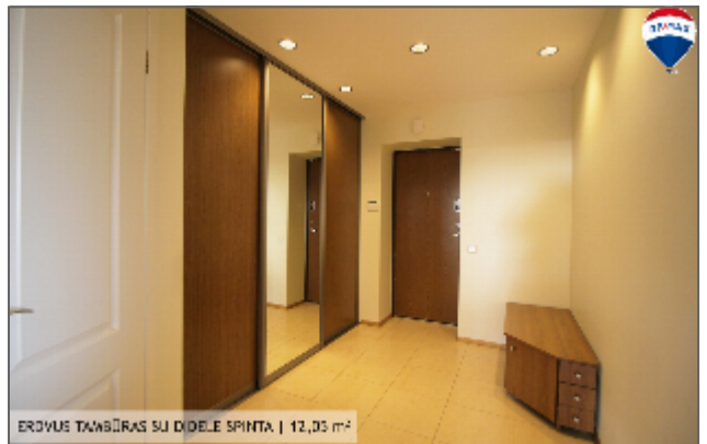
ERDVUS TAMBURAS SU DIDELE SPINTA | 12,03 m 2