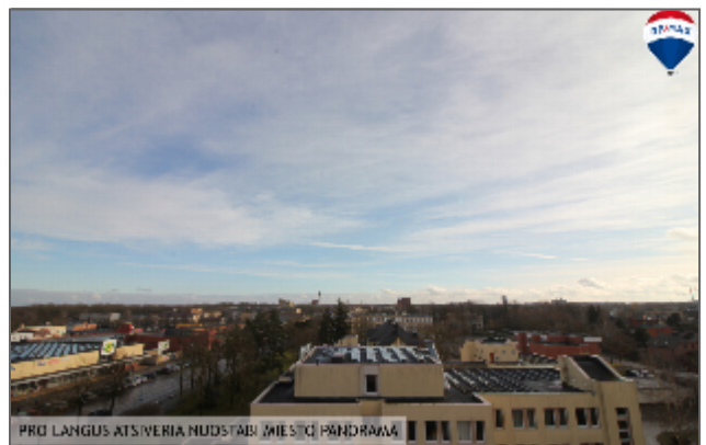
PRO LANGUS ATSIVERIA NUOSTABI MIESTO PĀRDRAMA