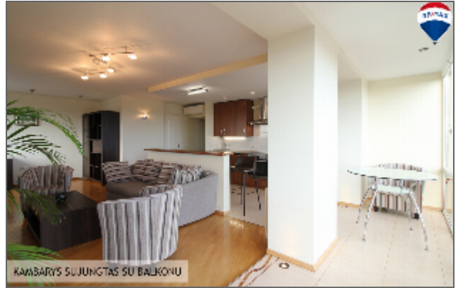
KAMBARIYS SUJUNGTA SU BALKONU