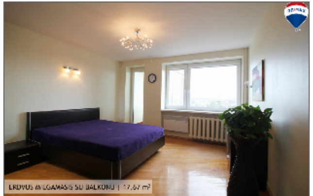
ERDVUS MUGAMASIS SU BALKONU | 17,67 m 2