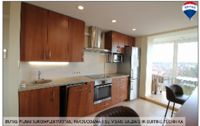
BUTAS PILNAI SUKOMPLEKTUOTAS, PARDOVAMA SU VISAIS BALDAIS IR BUTINE TECHNIKA