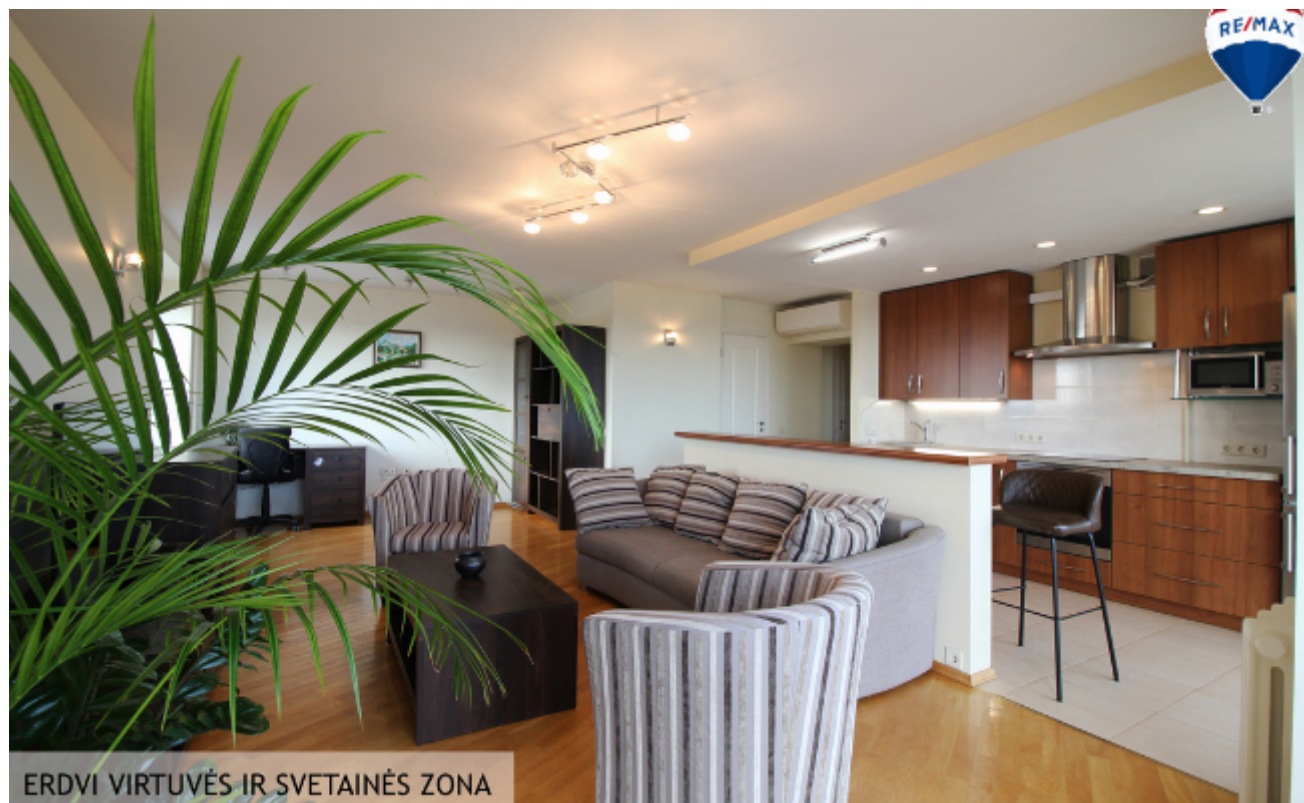
ERDVI VIRTUVĖS IR SVETAINĖS ZONA