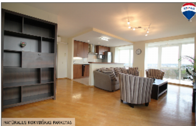
NATŪRALUS KOKYBIŠKAS PARKETAS