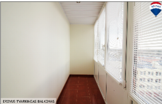
ERDVUS TVARKINGAS BALKONAS