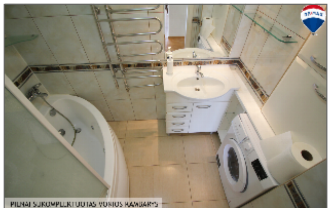
PILNAI SUKUMPLIKTUOTAS VONIUS KAMBARTS