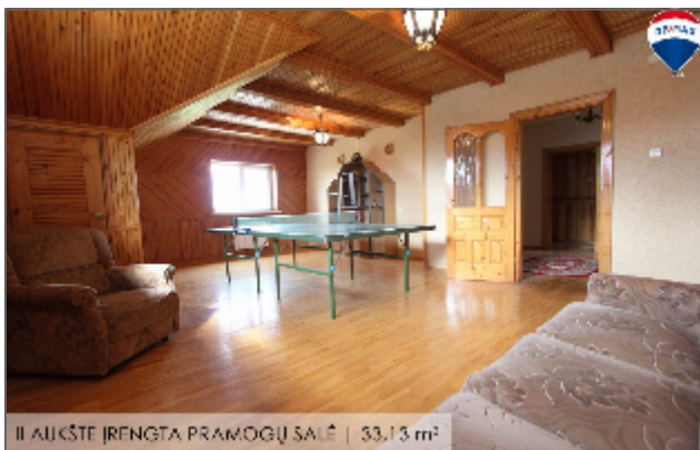
II AUKŠTE | RENGTA PRAMOGŪ SALĖ | 53,13 m 2