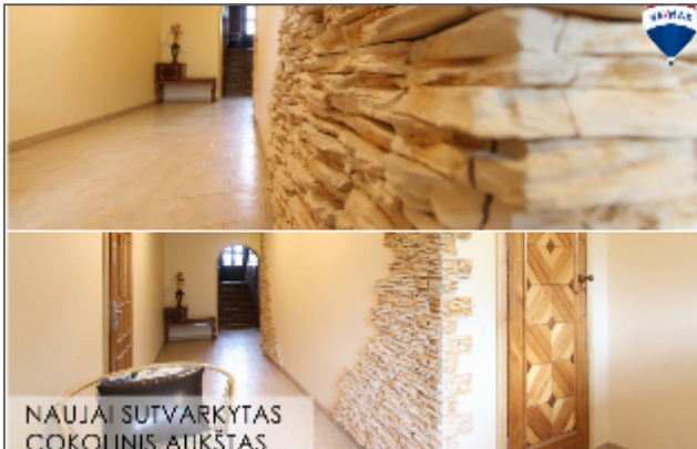
NAUJAI SUTVARKYTAS ČOKOLINIS AUKŠTAS