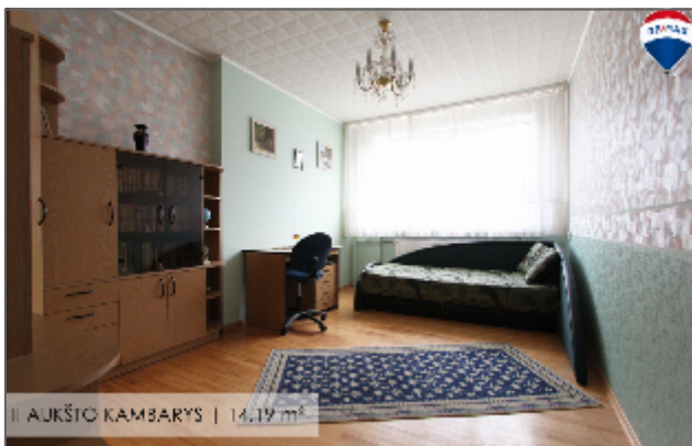
II AUKŠTO KAMBARYS | 14,19 m 2