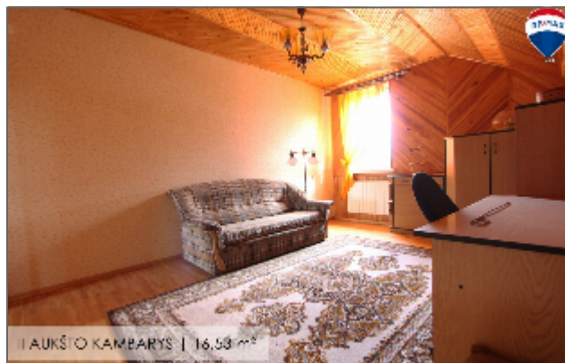
I AUKŠTO KAMBARYS | 16,58 m 2