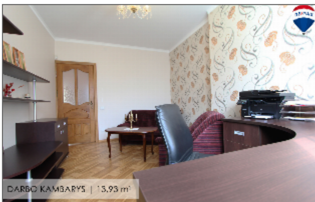
DARBO KAMBARYS | 13,93 m 2