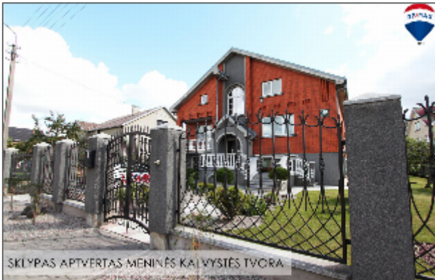
SKLYPAS APVERTAS MENINĖS KALVYSTĖS TVORA