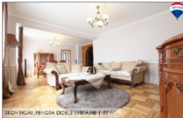
SKONINGAI | RENGTA DIDELE SVETAINE | 37 m 2