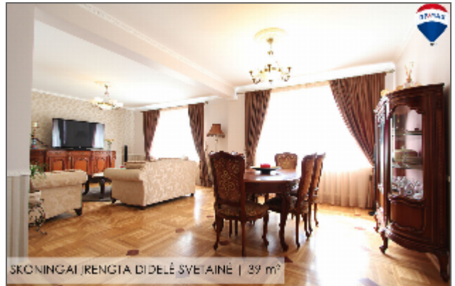
SKONINGAI ĮRENGTA DIDELĖ SVEITAINĖ | 39 m²