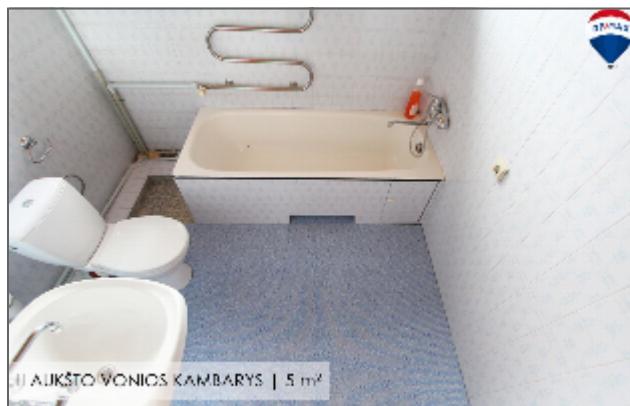
I AUKŠTO VONIOS KAMBARYS | 5 m 2