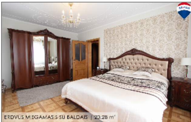
ERDVUS MIEGAMASIS SU BALDAIS | 20,28 m 2