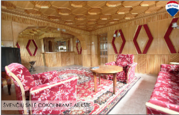
SVENČIŲ SALĖ ČOKOLINIAME AUKŠTE