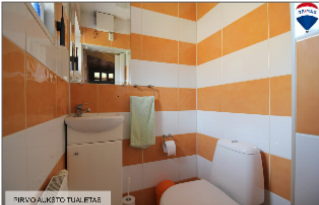
PIRVO ALKĒTO TUALĒTAS