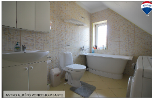
ANTRO ALKĖTO VONIO KAMBARYS