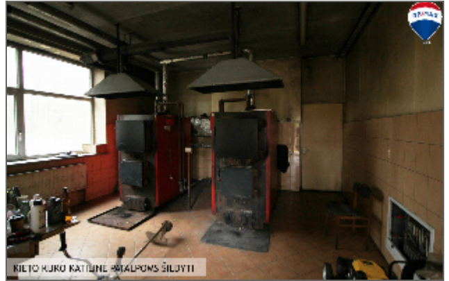
KIETO KURO KATILINE PATAUPONS ŠILUMŲI