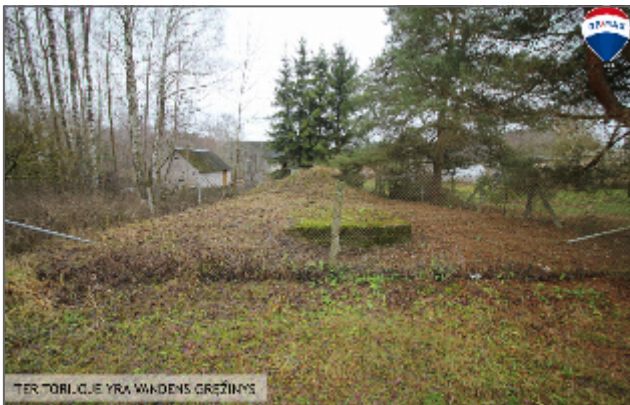
TER TOBILUJE YRA VANDENS GRĘŽINYS