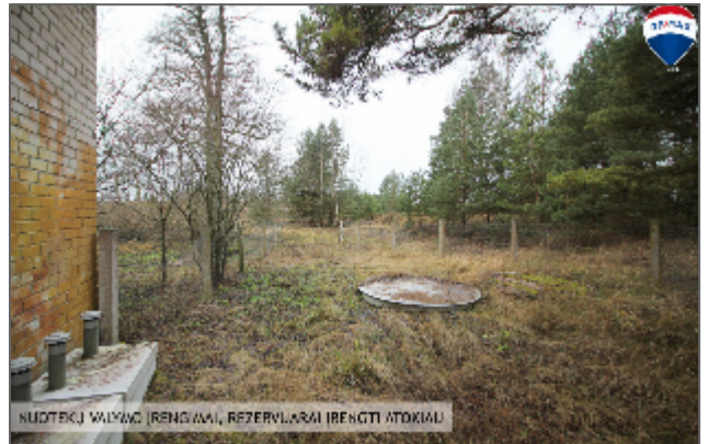
NUOTEKŲ VAIKŲ (RENKAMŲ), REZERVUARŲ (RENKTI ATOKIAU)