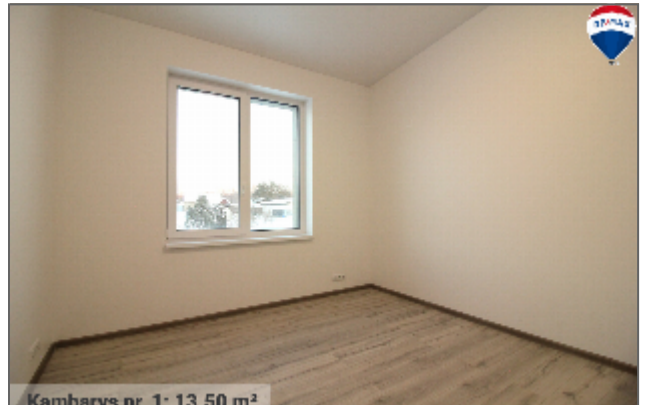
Kambarvs nr. 1: 13.50 m 2