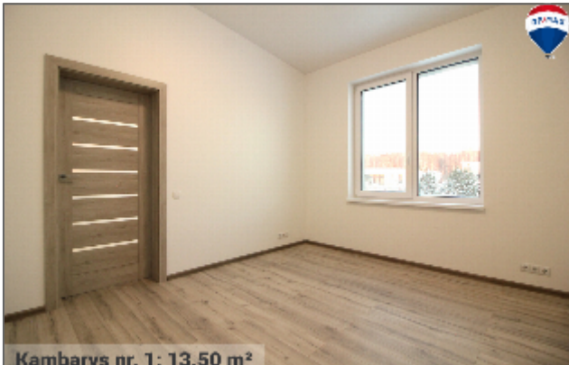
Kambarvs nr. 1: 13.50 m 2