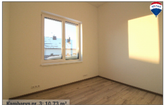
Kambarvs nr. 3: 10.73 m 2