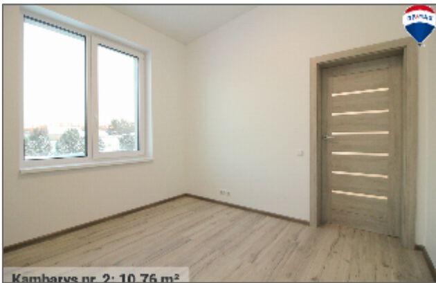
Kambarvs nr. 2: 10.76 m 2